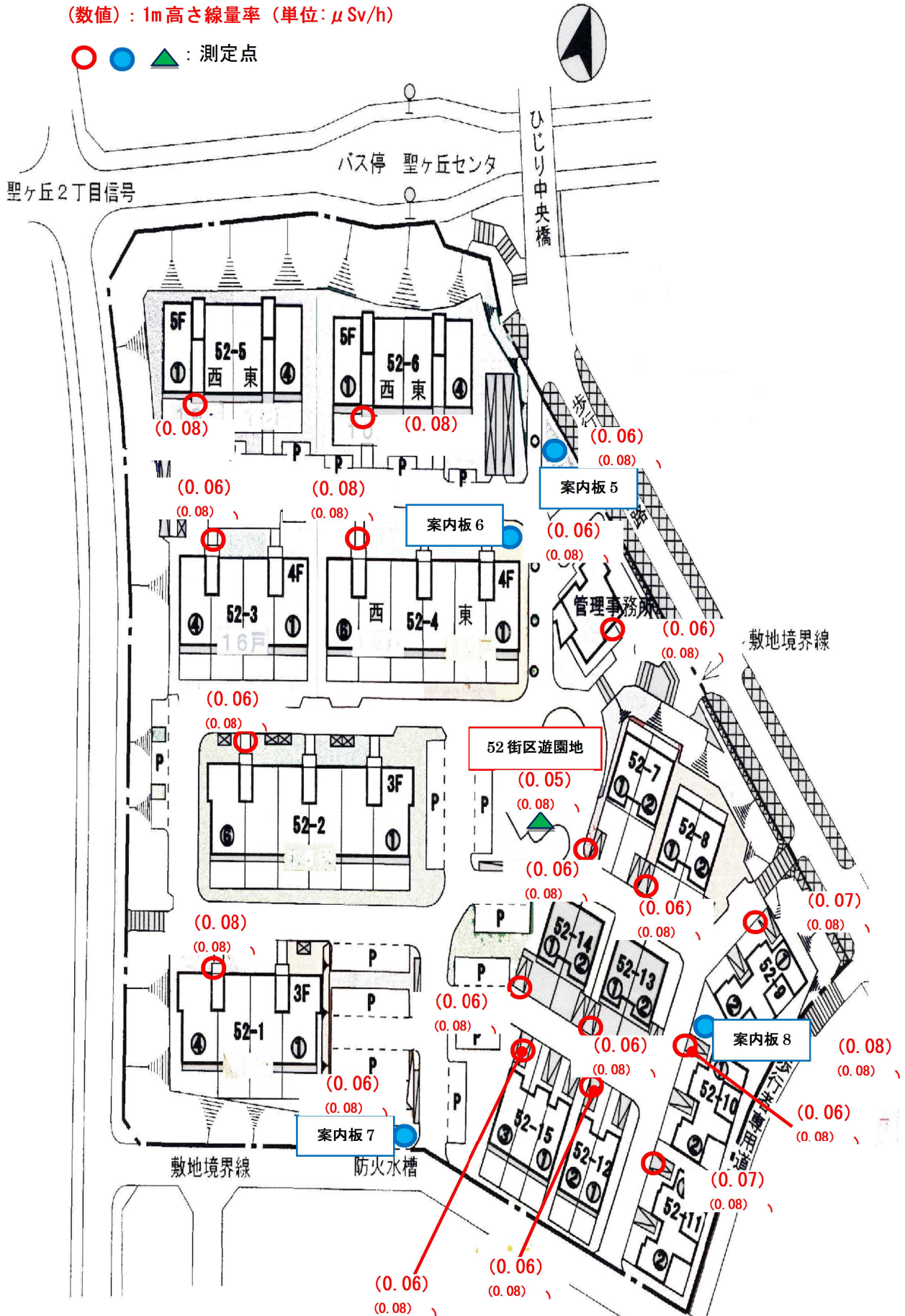
図-3 52街区 1m 高さ線量率測定結果